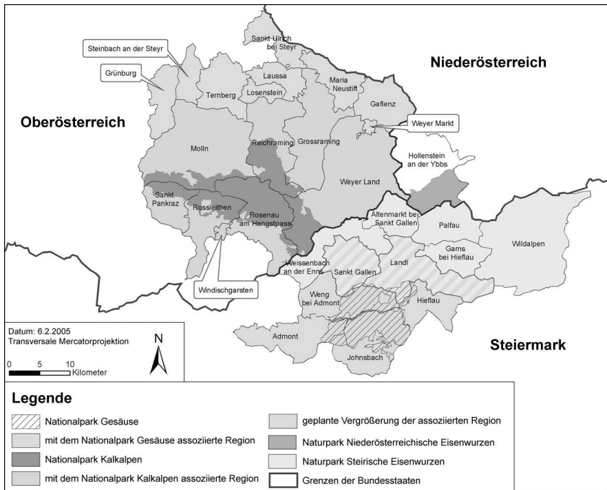
Abb. 2: Großschutzgebiete in der Region Eisenwurzten (eigene Darstellung).

Projekte entstehen. Ergebnisse sind u.a. die Einführung eines Gütesiegels für regionale Produkte und die Gründung des Vereins „Nahtur“, einer Kooperation von Landwirtschaft und Gastronomie. Mittlerweile haben der Nationalpark und die „Region Ennstal“ das ehemalige Flaggschiff der Region, das Projekt „Eisenstraße“, abgelöst. Der Regionale Entwicklungsplan der LAG ANNE (2000, 8) spricht sogar von „Nachnutzungsproblemen der abgeschlossenen Landesausstellung ‚Land der Hämmer‘“, wobei unklar bleibt, worin genau die Probleme bestehen. Ein weiterer deutlicher Hinweis darauf, dass dem historisch-kulturellen Erbe allein keine hohes Potenzial für die Regionalentwicklung mehr zugemessen wird, ist die Änderung der touristischen Vermarktungsstrategie: Vormals unter den Namen „Fremdenverkehrsregion Phyrn-Eisenwurzten“ bzw. „Eisenstraße – Land der Hämmer“ bekannt, wird die Region nun unter dem Namen „Region Ennstal“ in enger Assoziation mit dem Nationalpark „Kalkalpen“ beworben. Die Änderung der Strategie betrifft nicht allein die Außendarstellung: Die Mitgliedsgemeinden der Nationalparkregion setzen darauf, als „Musterregion einer nachhaltigen Kulturlandschaft“ auch wirtschaftlich Erfolg zu haben.